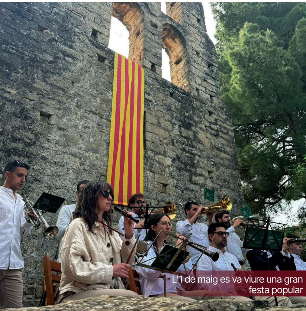
L'1 de maig es va viure una gran festa popular