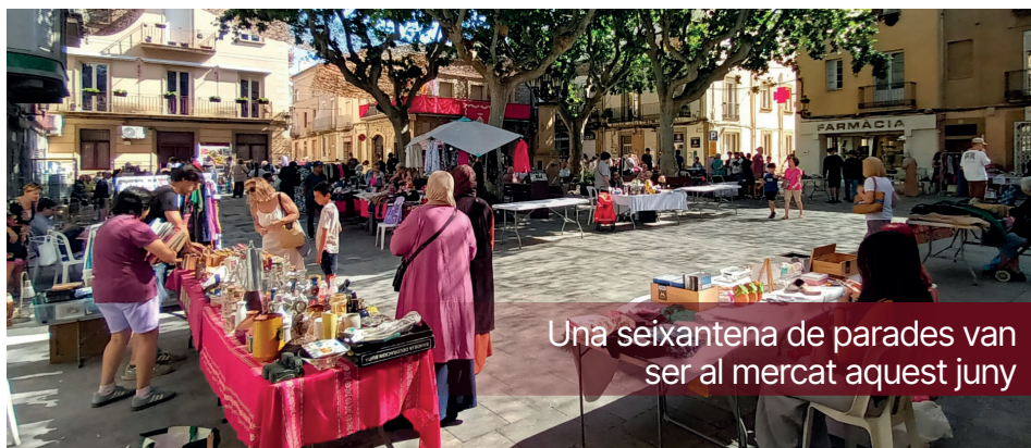
Una seixantena de parades van ser al mercat aquest juny

És un document estratègic que marcarà les polítiques en matèria de salut i benestar durant els pròxims anys. El pla s'ha elaborat de manera participativa i transversal, amb la implicació de professionals de diferents àmbits, entitats, agents socials i ciutadania. El document dona continuïtat al primer pla impulsat entre 2018 i 2023 i fixa noves línies de treball per afrontar els reptes en àmbits com la salut mental i emocional, els hàbits saludables, la cohesió social o la qualitat dels espais i equipaments públics.