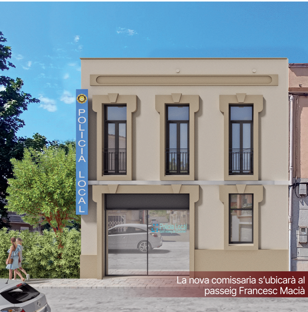
La nova comissaria s'ubicarà al passeig Francesc Macià